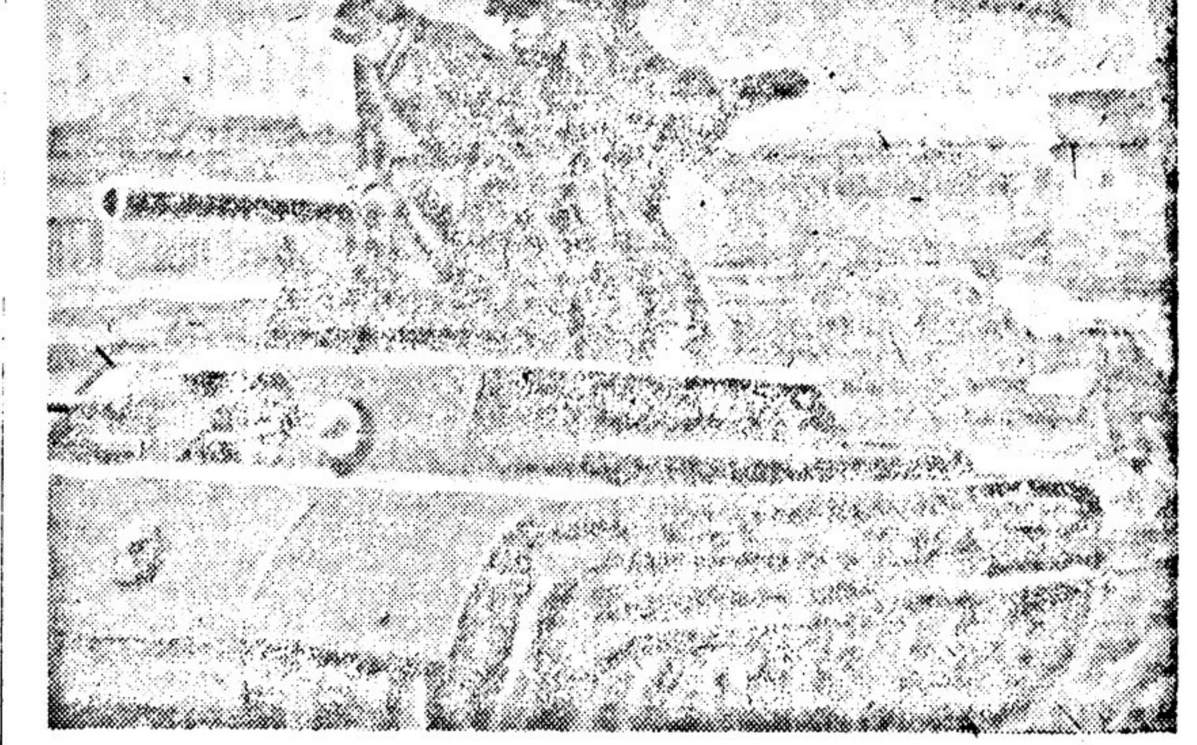
«Испытание танка». Картина А. ЛОВАНОВА. Выставка «Искусство Урала» (Свердловск).

Начался очередной концерт одной из бригад Центрального театра Красной Армии. Зрители в белых халатах, пришедшие непосредственно с огневых позиций, с непередаваемой жаждой впитывали в себя всё идущее и импровизированной сцене.