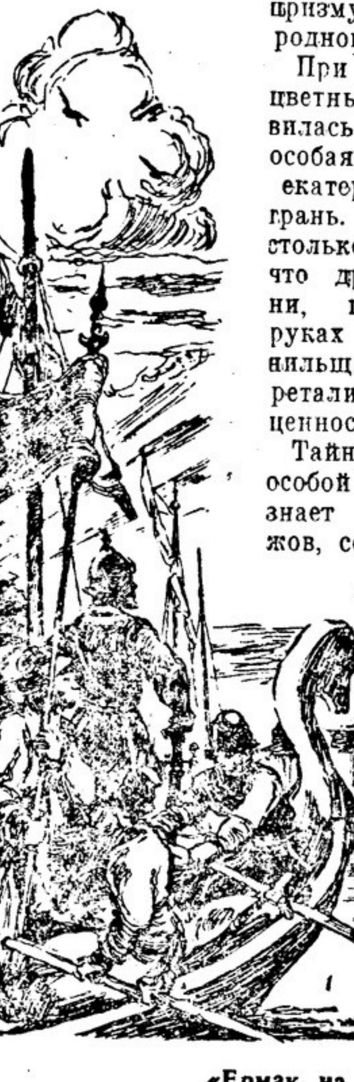
«Ермак на реке Чусовой». Иллюстрация В. ТАУБЕРА к сказке П. Бажова «Ермаковы лебеди».

Нас всегда останется в памяти читателя берия из «Травной западницы», способный к одному ремеслу: «железобов по кругу на верёвке гонять».