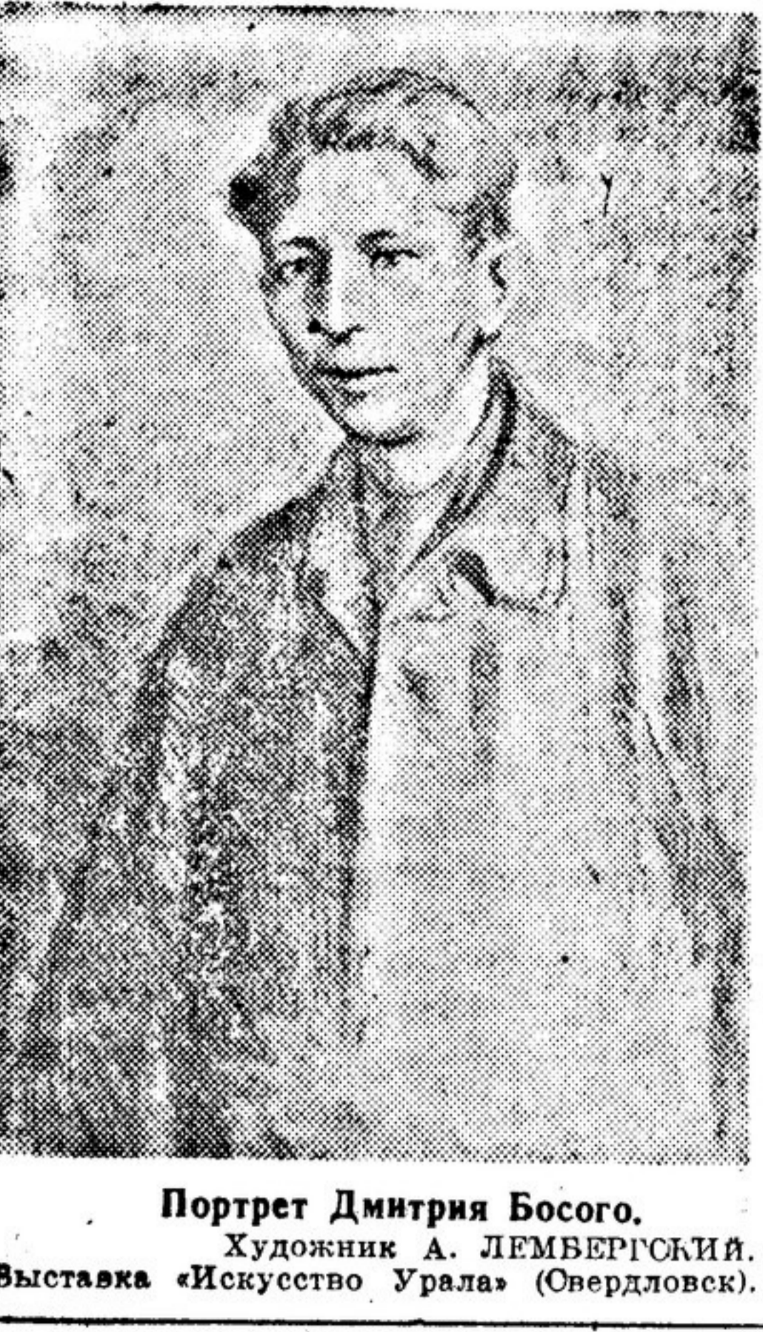
Портрет Дмитрия Богосова. Художник А. ДЕМЬЕРСКИЙ. Выставка «Искусство Урала» (Свердловск).