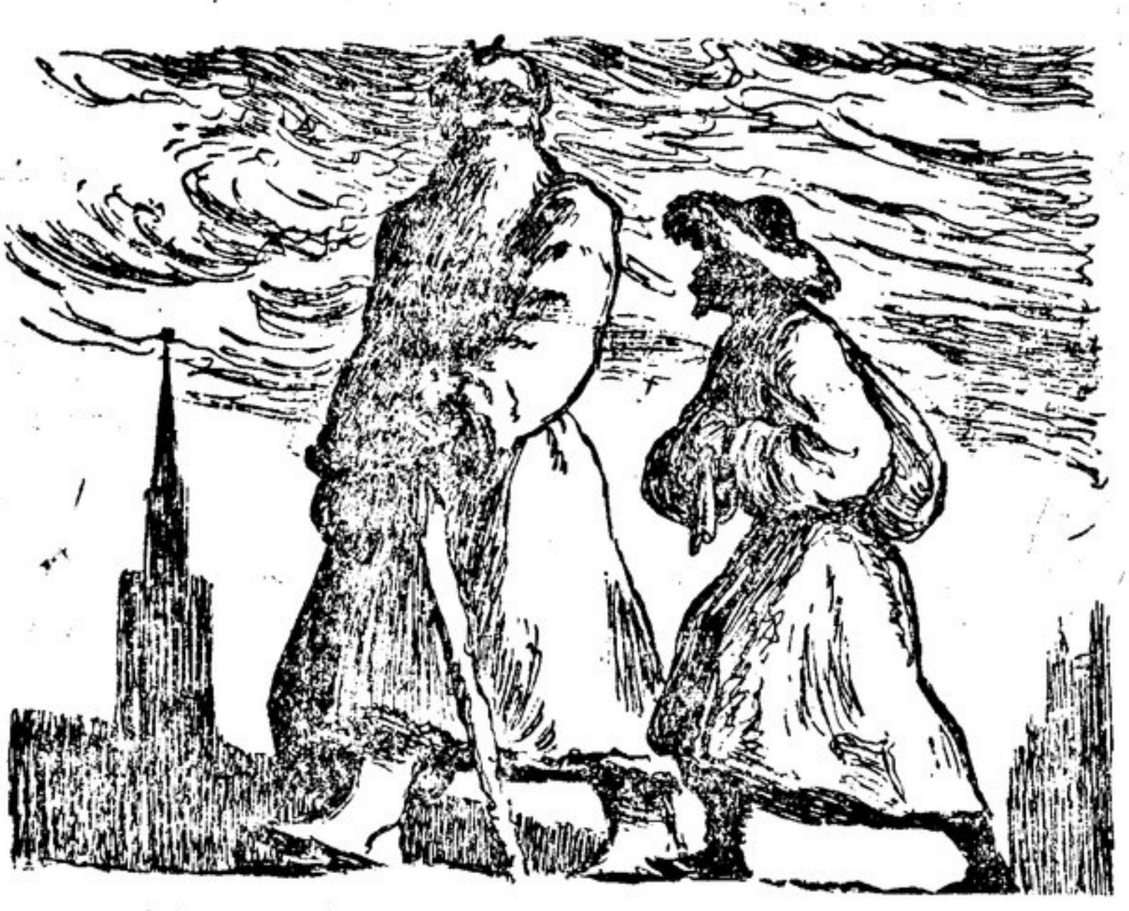
«Уральские ходоки идут к Ленину». Иллюстрация В. ТАУБЕРА к сказке П. Бажова «Солнечный камень».